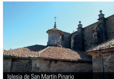
Iglesia de San Martín Pinario

En el marco del programa de restauración de monumentos del Consorcio de Santiago, el organismo acaba de licitar varias obras. En la iglesia de San Martín Pinario se van a reparar las cubiertas de las capillas; en la iglesia de San Frutuoso se intervendrá en el tejado, se limpiarán las fachadas y el campanario; y en la capilla de Santas Mariñas de Sar se reparará el tejado, se renovará la pintura de las fachadas y se reparará el revestimiento de madera del muro a la calle.